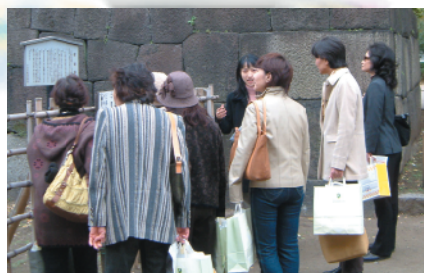
高低差が少ないルートを徒歩で巡ります。ガイドの説明を聞きながら約2時間でいくつもの名所を堪能できる魅力のコースです。

実施日 2008年9月までの第3・第4火曜日 ※祝祭日を除く 4月15日(火)・22日(火) 5月20日(火)・27日(火) 6月17日(火)・24日(火) 7月15日(火)・22日(火) 8月19日(火)・26日(火) 9月16日(火)