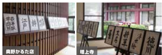
*写真は昨年の様子です。