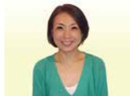
三井不動産商業マネジメント(株)日本橋オペレーションセンター 日本橋オペレーションセンター