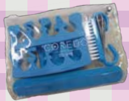
コレド日本橋 ネイルケアキット