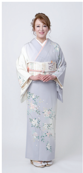
撮影／山上忠 衣裳／衣袋くや 撮影協力／ロイヤルパークホテル ヘアアレンジ・着付け／林さやか

やさしい春の花を写した薄紫の片身替り模様の本加賀友禅に、四季の花々が織り込まれた華やかな帯をコーディネートしたエレガントな装いです。可愛らしいピンクの小物を差す色に添えて、瑞々しい雰囲気を出しています。