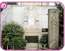
日本橋魚河岸記念碑 日本橋室町 1-8-1 先

協力 東京商工会議所中央支部 www.tokyo-cci.or.jp/chuo 日本橋倶楽部 http://www.nihonbashiclub.or.jp 日本橋地域ルネッサンス100年計画委員会 www.nihonbashi-renaissance.com 日本橋法人会 www.nihonbashi-hojinkai.or.jp 名橋「日本橋」保存会 www.tcbnavi.com/meikyou/meikyou.html 日本橋OLクラブ www.tcbnavi.com/nihonbashi-ol