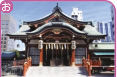
水天宮 日本橋蛸薬町 2-4-1