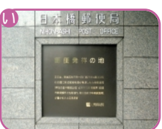
郵便発祥の地 日本橋 1-18-1

②木原店跡 ③江戸秤座跡 ④銀杏八幡宮 ⑤兜塚 ⑥鯉の渡し跡 ⑦海運橋親柱 ⑧銀行発祥の地 ⑨其角住居跡 ⑩小網神社 ⑪村屋勝三郎歴代記念碑・吉田松陰終焉之地・伝馬町半屋敷跡 ⑫谷崎潤一郎生誕の地 ⑬茶の本神社 ⑭蛸薬座跡 ⑮大観音寺・鉄造菩薩像 ⑯賀茂真淵縣居の跡 ⑰福森神社 ⑱文治店 ⑳日本銀行創業の地 ㉑漢方医学復興の地 ㉒空閑稲荷神社 ㉓明治座 ㉔震災避難記念碑 ㉕賀茂真淵縣居の跡 ㉖福森神社 ㉗富塚陣 ㉘日本銀行 ㉙金座跡 ㉚常盤橋門跡 ㉛於竹大日如來井戸跡 ㉜實田恵比寿神社 ㉝三浦按針屋敷跡 ㉞三井本館 ㉟十軒店跡 ㊱長崎屋跡 ㊲両国広小路記念碑 ㊳漱石名作の舞台の碑・名水白木屋の井戸 ㊴福徳神社