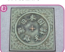
日本国道路元標 日本橋室町 1-1