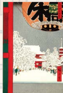
歌川広重 「浅草金竜山」(名所江戸百景)