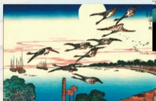
歌川広重「高輪之名月」(東都名所)