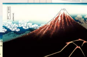
葛飾北斎「山下白雨」(富嶽三十六景)