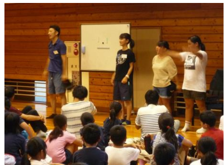
生活の約束を説明する中学生リーダー(右2名) 今年は4名の中学生が参加してくれました

※募集の内容につきましては、来年度の開催要綱が決定次第、ご登録いただいたメールアドレスにご案内をお送りさせていただきます。